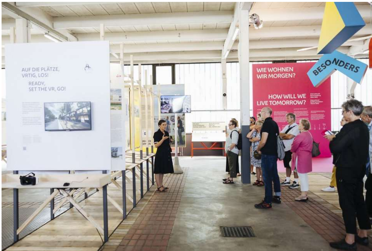
Ffigur 3: Arddangosfa 'Wie Wohnen Wir Morgen?' neu 'Sut Fyddwn Ni'n Byw Yfory?'

Roedd ail gymal ein hymweliad yn cynnwys taith dywys o amgylch arddangosfa 'Wie Wohnen Wir Morgen?' neu 'Sut Fyddwn Ni'n Byw Yfory?', sy'n rhan o Arddangosfa Adeiladau Ryngwladol Fienna 2022 ar dai cymdeithasol yn Fienna yn y presennol a'r dyfodol. Cynhaliwyd yr arddangosfa gan IBA Vienna ar ran Dinas Fienna (Awdurdod y Ddinas). Nod yr arddangosfa oedd ysgogi, galluogi a chefnogi datblygiadau newydd ar gyfer dyfodol tai cymdeithasol, a'r broses o'u rhoi ar waith. Roedd cwmpas yr arddangosfa yn eang, ac yn ymwneud â themâu fel: