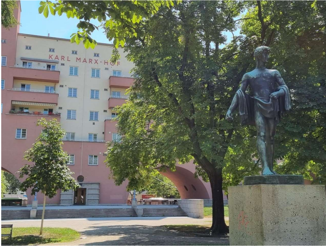
Ffigur 1: Cwrt mewnol Karl-Marx-Hof