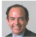
Nick Bourne Canolbarth a Gorllewin Cymru Plaid Geidwadol Cymru