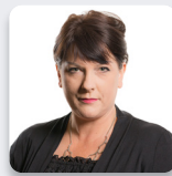
Rhianon Passmore AS Llafur Cymru