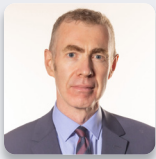
Adam Price AS Plaid Cymru