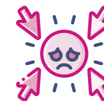
Aflonyddu rhwng cyfoedion ymhlith disgyblion ysgolion uwchradd yng Nghymru