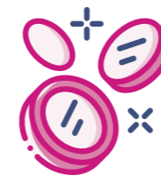
Cyllideb Ddrafft Llywodraeth Cymru