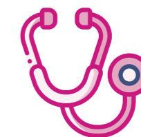
Rhyddhau cleifion o'r ysbyty