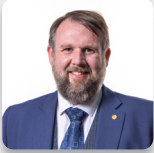
Cadeirydd y Pwyllgor: Peredur Owen Griffiths AS Plaid Cymru