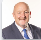
Peter Fox AS Ceidwadwyr Cymreig